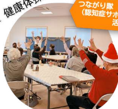
つながり隊 (認知症サポーター) 活動中!