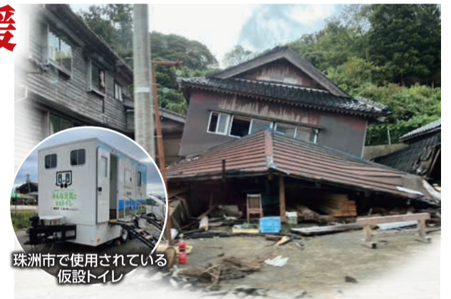
珠洲市で使用されている仮設トイレ

初日は、みなし仮設住宅を訪問し、生活状況などの対話では、「家の修理費の援助金が少ない、大工の人手が足りない」などが原因で、再建が難しいという厳しい現状がうかがえました。また、その他にも仮設住宅集会所にて輪投げやポッチャ、すごろくなどで住民と交流したり、被災者のお宅へ片づけのボランティア活動、各避難所へ支援物資を届けるなどしました。避難所では、今も段ボールで仕切られたスペースで生活している方がいま