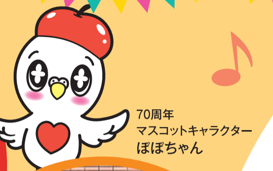
70周年 マスコットキャラクター ぼぼちゃん