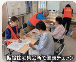
仮設住宅集会所で健康チェック

現地では、今もなお、倒壊した家屋がそのままの状態になっていたり、珠洲市では仮設トイレや発電機から電気を使用していたりと復興はまだ進んでいない状況です。