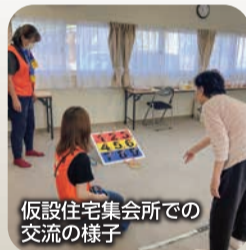
仮設住宅集会所での交流の様子