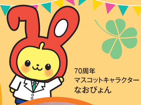
70周年 マスコットキャラクター なおじよん