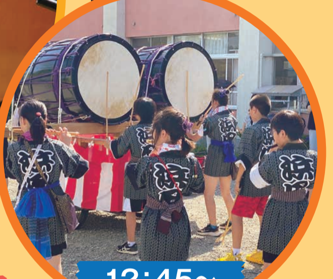
12:45～ 浜田小学校 ねぶた囃子演奏