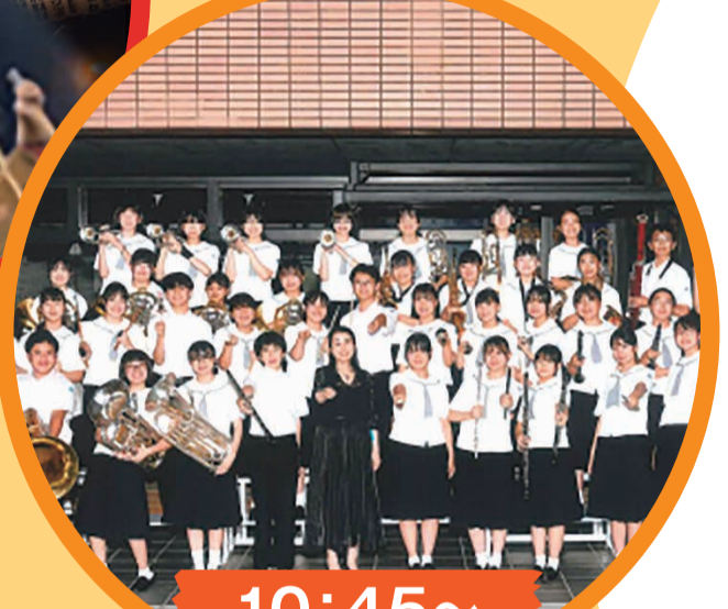
10:45～ 新城中学校 吹奏楽演奏