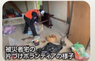
被災者宅の片づけボランティアの様子