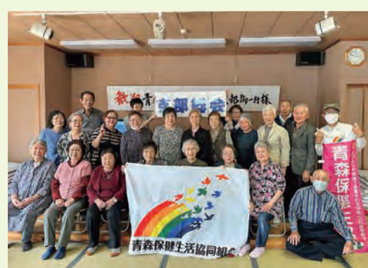
24.5.19 新城支部・石江支部合同