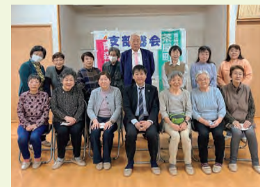
24.5.29 茶屋町・港町支部