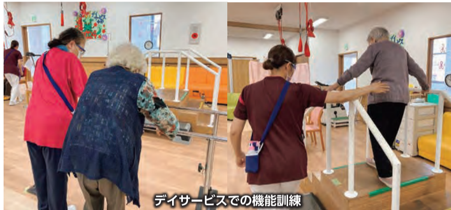
デイサービスでの機能訓練