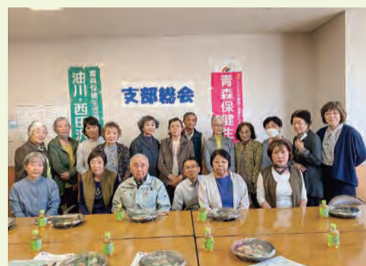
24.6.7 油川・西田沢支部