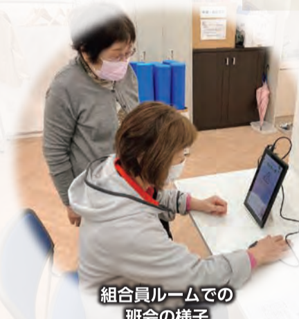
組合員ルームでの班会の様子

院内の組合員ルームも多くの支部・班や組合員の方に利用していただいておりますが、地域の方も含めてもっと多くの方に利用していただき、「つどいの場」としていただければと考えております。